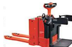
Chariot élévateur à timon à conducteur porté, catégorie A2

Reconnaissance OACP d'une journée de cours dans le cadre de la formation continue des chauffeurs poids lourds