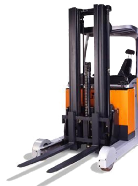
Chariot élévateur à mât-rétractable, catégorie A4

Reconnaissance OACP d'une journée de cours dans le cadre de la formation continue des chauffeurs poids lourds