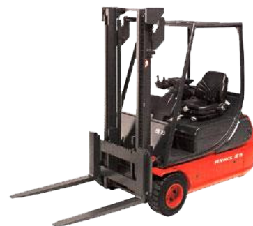
Chariot élévateur à contrepoids, catégorie A3